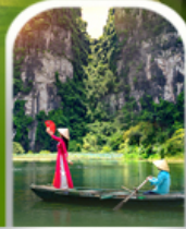
ล่องเรือตามก๊ก (ฮาลองบ๊ก)

ชมนาขั้นบันได หมู่บ้านท่าฟาน ▪ โบสถ์หินซาปา โมอาน่า คาเฟ่ ถนนคนเดินซาปา ▪ ทะเลสาบตะวันตก ▪ เจดีย์วัดเงินทิว ทะเลสาบคินดาบ ▪ ถนน 36 สายเก่า ▪ ล่องเรือตามก๊ก