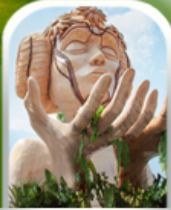
โมอาน่า คาเฟ่