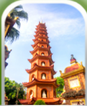
เจดีย์เงินทิว