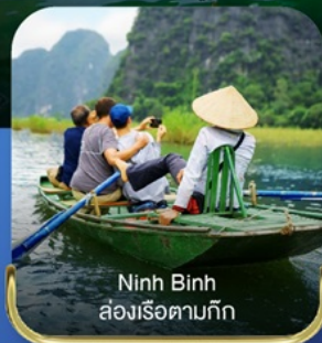
Ninh Binh ล่องเรือตามกัก