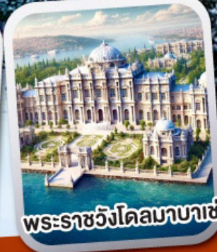
พระรลชวังคึลบบมบาชึ