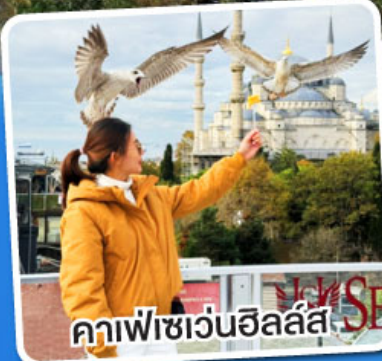
คาเฟ่เซเวนฮิลล์ส

ฟรี!! พวงกุญแจ Evil Eye ชาแอปเปิ้ล, โยเกิร์ตมาโก