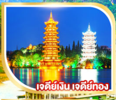
เจียดี้จิน เจียดี้ทอง