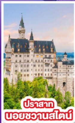
ปราสาท นอยชวานสไตน์