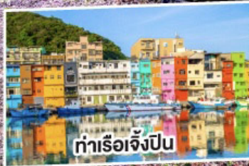
ท่าเรือเจ๋งป็น