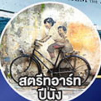
สตรีทอาร์ต ปีนัง