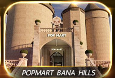
POP MART BANA HILLS

สัมพัสความงามหมู่บ้านฝรั่งเศสที่บานาฮิลล์ ซอปปิง POPMART