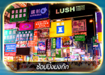
ช้อปปิ้งมอลล์

เต็มอิ่มทั้งบุญ และ ช้อปปิ้งแบบจัดเต็ม จิมซาจู้ย มงก๊ก เกาะฮ่องกง ชมวิวอ่าววิคตอเรีย วัดเจ้าแม่ทับทิม เจ้าแม่ทวนอิม หาดริพัลส์เบย์ วัดหลินฟา โรงงานจิวเวอร์รี่