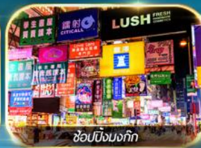
ช้อปปิ้งมงก๊ก

เต็มอิ่มทั้งบุญ และ ช้อปปิ้งแบบจัดเต็ม จิมซาจุ่ย มงก๊ก