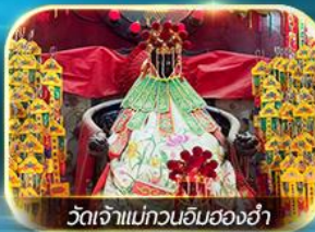
วัดเจ้าแม่กวนอิมสองอ่า