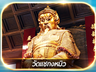
วัดเข็กงหมิว