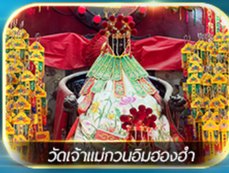
วัดเจ้าแม่ทวนอิมสองอ่า