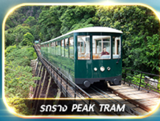
รถราง PEAK TRAM