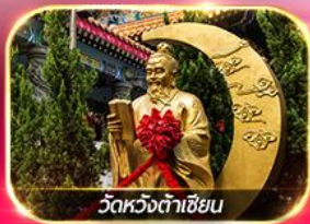
วัดหวงต้าเซียน