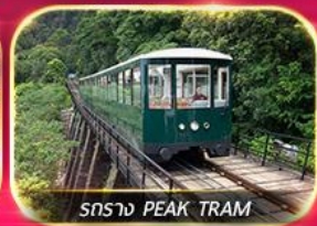
รถราง PEAK TRAM

เที่ยวสวนสนุกแบบจัดเต็ม ทั้งอิมบุงุญ และ ซอปบิง จิมซาจู้ย มงก๊ก