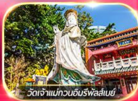
วัดเจ้าแม่กวนอิมรพัสเลนซ์