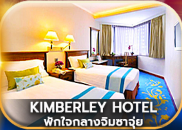
KIMBERLEY HOTEL พักใจกลางจิมซาจุ่ย