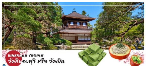
GINKAKUJI TEMPLE วัดกินคะคุจิ หรือ วัดเงิน

จากนั้นนำท่านสู่ วัดกินคะคุจิ (Ginkakuji Temple) หรือ วัดเงิน (ใช้ระยะเวลาในการเดินทางประมาณ 15 นาที) เป็นอีกหนึ่งในสถานที่ที่ขึ้นทะเบียนกับองค์การยูเนสโกให้เป็นมรดกโลกด้านวัฒนธรรม ซึ่งวัดกินคะคุจิเป็นวัดนิกายเซน ถูกสร้างขึ้นโดยโชกุนอชิคากะ โยชิมาสะ หลานชายของท่านโชกุน ที่สร้างวัดกินคะคุจิ (Kinkakuji Temple) หรือ ที่รู้จักกันอย่างกว้างขวางว่าวัดทองสำหรับอาคารของวัดเงิน สร้างขึ้นในรูปแบบเดียวกัน เพียงแต่จะไม่ได้มีสีทอง เป็นอาคาร 2 ชั้น และมีนกฟีนิกซ์อยู่บนหลังคา