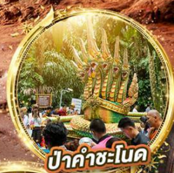
ปากคำชะโนด