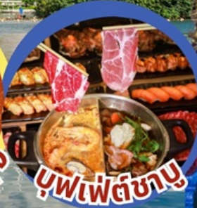
บุฟเฟต์ซาบู