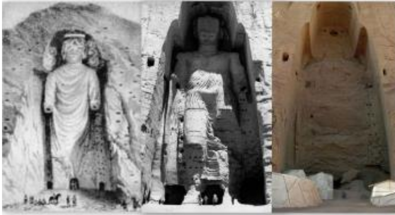
Drawing of the Buddha of Bamiyan by Alexander Burns during his visit in 1832