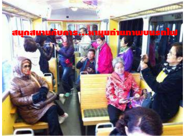
สนุกสนานกับคาร...หาหมอบถ่ายภาพบนรถไฟ

อยากสนุกสนาน และประทับใจกันแบบนี้... มาเที่ยวกับเรา: ครีบรับรองไม่ผิดหวัง