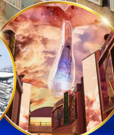
INSPIRE Entertainment Resort

ชมจอ LED ขนาดยักษ์ที่รีสอร์ท 5 ดาว ใหญ่ที่สุดในเอเชียเหนือ ชมพระราชวังคยองบกคยอง ย้อนอดีตหมู่บ้านบุคซอน อันอก ใส่ชุดอันบก ทำข้าวห่อสาหร่าย อิสระช้อปปิ้ง Lotte Duty Free