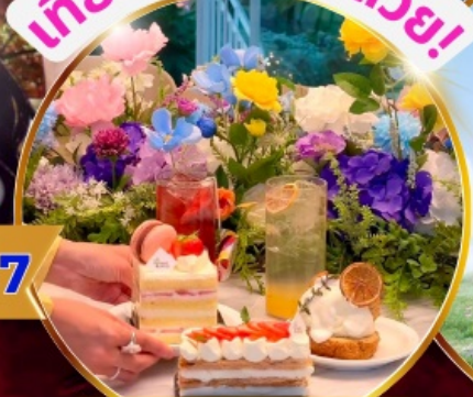
คาเฟ่ดัง Forest Outing