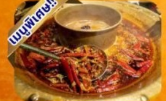
หม้อไฟเสฉวน