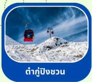
ต้ากู่ปิงชวน