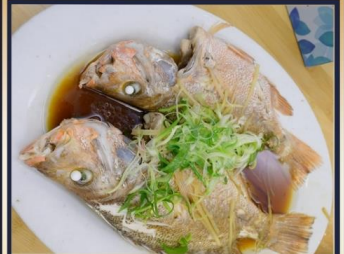
ปลาหนึ่งซีอิ้ว