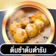
ติ่มซำต้นตำรับ

การ์ดิ!! พักทง 4 ดาว THE KOWLOON HOTEL ตึกถนนนาธาน ย่านช้อปปิ้งจิมซาจู้