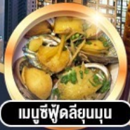
เมมูซึฟู้ดลี่ยุมบุน