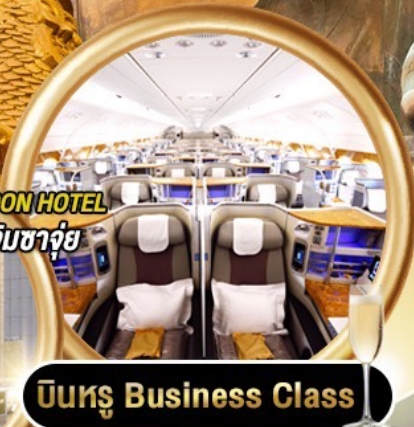
บินทง Business Class