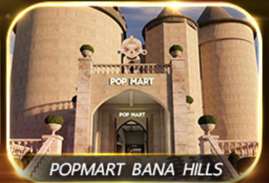
POP MART BANA HILLS

สัมพัสความงามหมู่บ้านฝรั่งเศสที่บานาฮิลล์ ซอปปิง POPMART