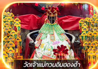
วัดเจ้าแม่ทวนอิมของฮ่า