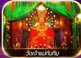
วัดเจ้าแม่ทับทิม