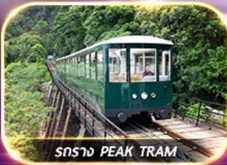
รถราง PEAK TRAM