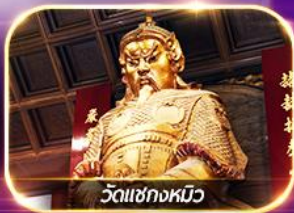
วัดเซกกงหมิว