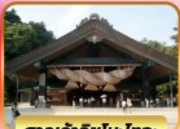
ศาลเจ้าอิซุโมะโทวะ