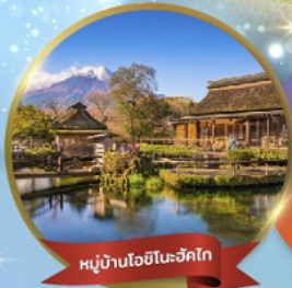
หมู่บ้านโอชิโนะซึกิโก