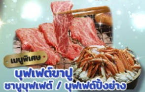
เมนูพิเศษ