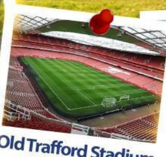
Old Trafford Stadium