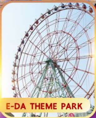
E-DA THEME PARK