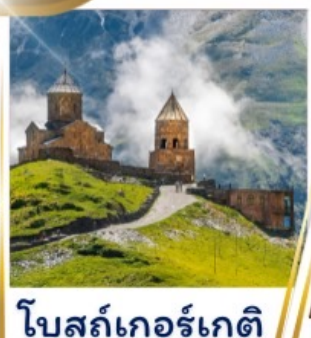
โบสถ์เกอร์เกติ