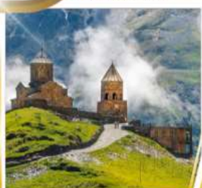
โบสถ์เกอร์เกตี