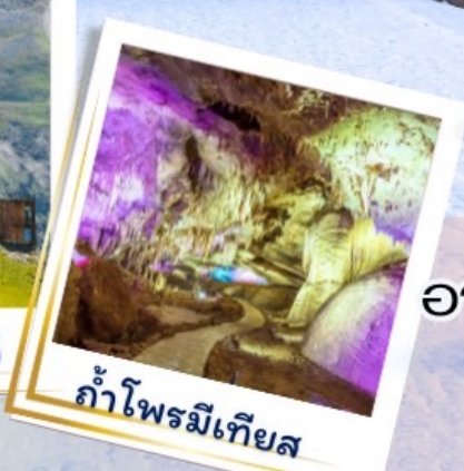
ถ้ำไฟรมีเทียส