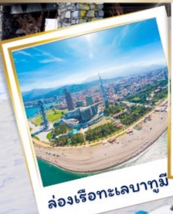
ล่องเรือทะเลบากูมี