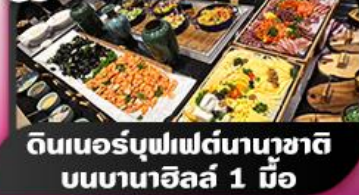
ดินเนอร์บุฟเฟต์นานาชาติ บนบานาฮิลล์ 1 มื้อ