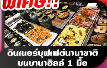
ดินเนอร์บุฟเฟต์นานาชาติ บอนบานาฮิลล์ 1 มื้อ