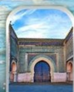
KASBAH OF MOULAY ISMAIL