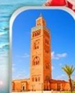
JEMAA EL-FNAA MARRAKESH