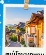
หมู่บ้านนุกซอน