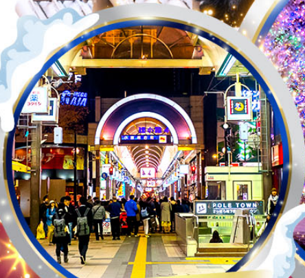
ถนนทานุกิโคจิ