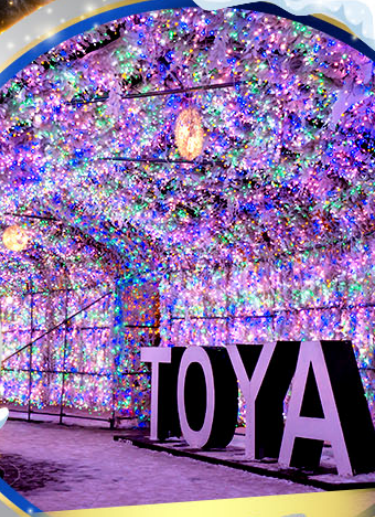
เทศกาลประดับไฟไทยะ