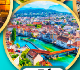
ลูเซิร์น