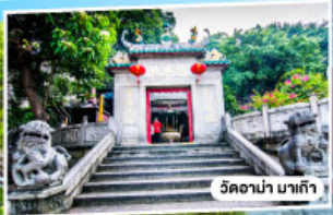
วัดอานา มาเก๊า