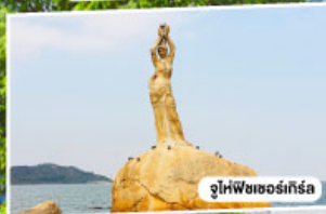
จูไห่พีซเซอร์เกิร์ล