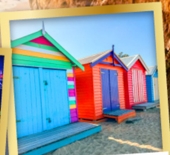
ไบรด์ตัน บาร์ตัง บ็อกซ์

03-10, 12-19 เม.ย.68 24 เม.ย.-01 พ.ค.68 08-15, 22-29 พ.ค.68 29 พ.ค.-05 มิ.ย.68