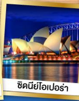
ซิดนีย์โอเปร่า