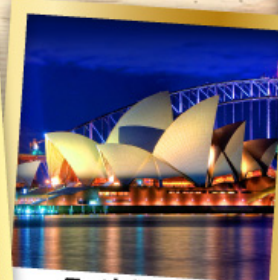
ซิดนีย์โอเปร่า