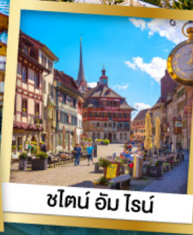
ชไตน์ อัม โรน์