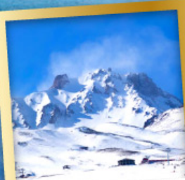
ภูเขาไฟเออซีเยส์