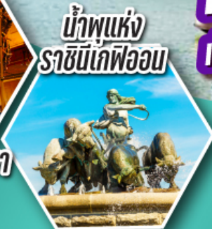
น้ำพุแห่ง ราชินีเดฟวอน

ค้างคืนบนเรือสำราญ 2 ลำ เรือสำราญ TALLINK SILJA LINE และ เรือสำราญ DFDS