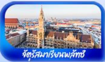
จัตุรัสมาเรียเนพลิกซ์