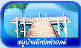
หมู่บ้านอิเซลทออลด์