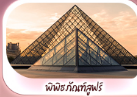
พีพิดกับที่ลูฟวร์