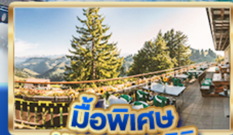
มือพิเศษ บนยอดเขารัก