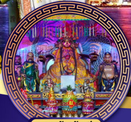
ศาลเจ้าหังเจีย