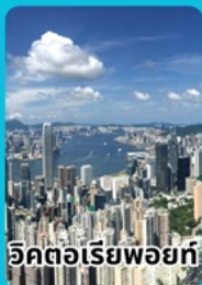
วิวทิวทัศน์ฮ่องกง