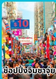
ช้อปปิ้งจิมซาจุ้ย