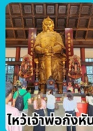
ไหว้เจ้าพ่อก้งหัน