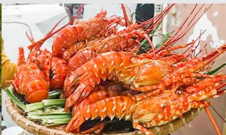
Nha Trang Night Market

*ทางบริษัทฯ ขอสงวนสิทธิ์ในการสลับโปรแกรมทัวร์ตามความเหมาะสมขึ้นอยู่กับสถานการณ์หน้างาน โดยคำนึงถึงผลประโยชน์ของลูกค้าเป็นสำคัญ