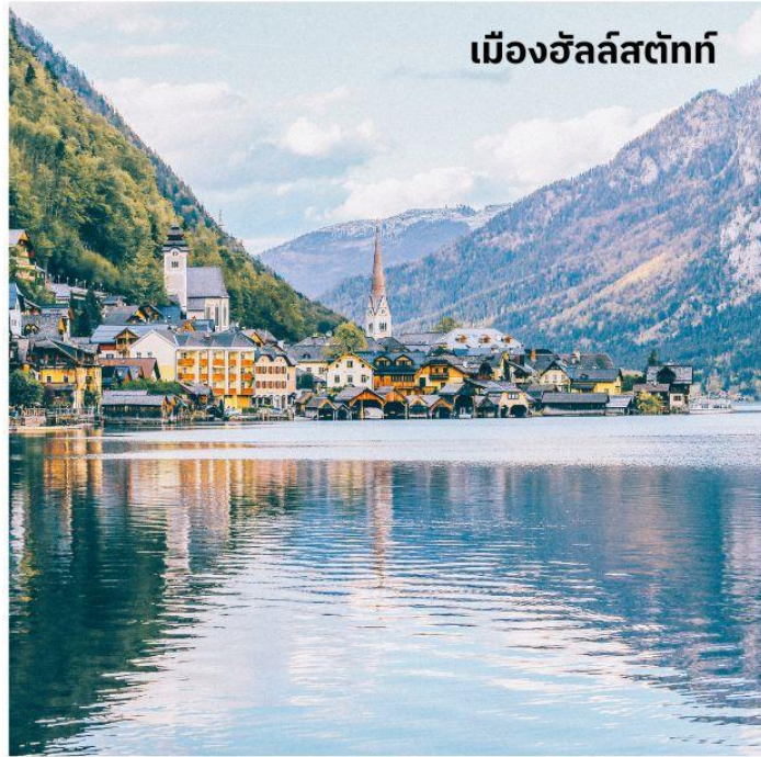
เมืองฮัลล์สตัดท์