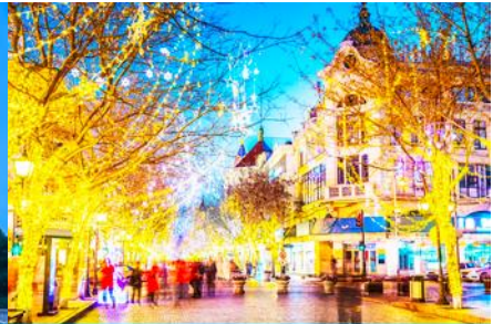
ถนนจางยู่

วันที่ห้า เมืองฮาร์บิน – โบสถ์โซเฟีย - อนุสาวรีย์ป้องกันอุทกภัย-ถนนจางยู่ – นั่งรถไฟความเร็วสูงกลับเมืองต้าเหลียน – จัตุรัสซิงไห่ – ถนนรัสเซีย