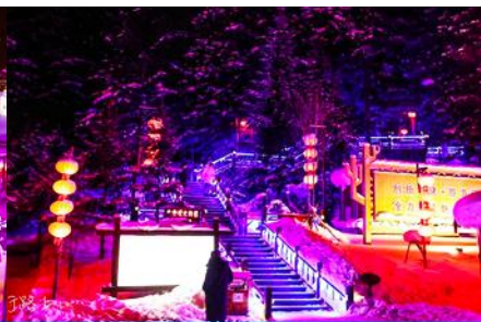
ระเบียงชมวิว ปั้งดูยซาน