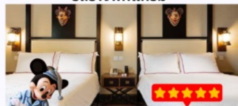
พัก Disney Explorers Lodge 5 ดาว 1 คืน