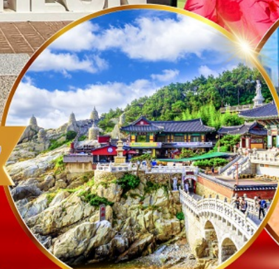
วัดแสงยงกุงซา