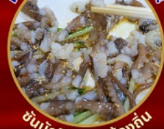
ชั้นนักกีฬาอาหารท้องถิ่น