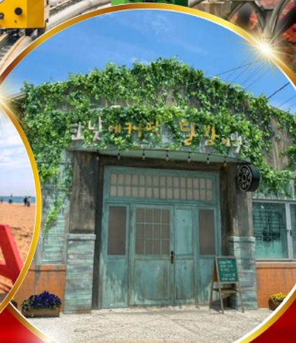
ตามรอยซีรีส์ดัง Hometown chachacha

โพฮังสเปซวอล์ก สกายวอร์ค ตามรอยซีรีส์ Hometown chachacha ถ่ายรูปชิคๆ หมู่บ้านวัฒนธรรมคิมซอน ขึ้นเคเบิลคาร์ ชมทะเลปูซาน นั่งรถไฟปู๊กบีก sky capsule ชิมของอร่อยตลาดแฮუნแด อิสระช้อปปิ้ง Lotte Duty Free